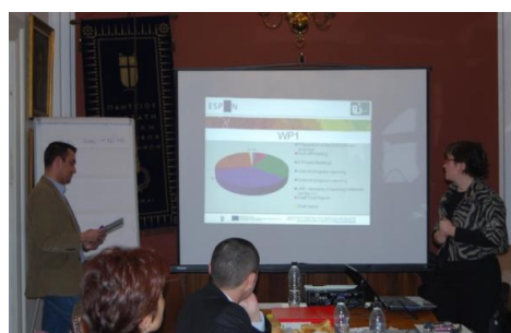
Στιγμιότυπα από τη Συνάντηση